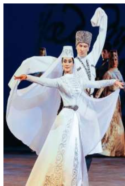
Танец «Хонга» являлся танцем- приглашением мужчины своей возлюбленной.

Далее перейдем к обсуждению творчества. Одними из главных традиционных танцев являются массовый танец «Симд» и плавный танец-приглашение «Хонга». Раньше, во времена наших предков, строго запрещалось прикасаться к девушке, если она не являлась твоей женой, и именно во время танца «Симд» мужчине выпадала возможность прикоснуться к своей возлюбленной. В танце он всегда держал зрительный контакт с девушкой, а она, в свою очередь, смотрела на его грудь и не поднимала на взгляд.