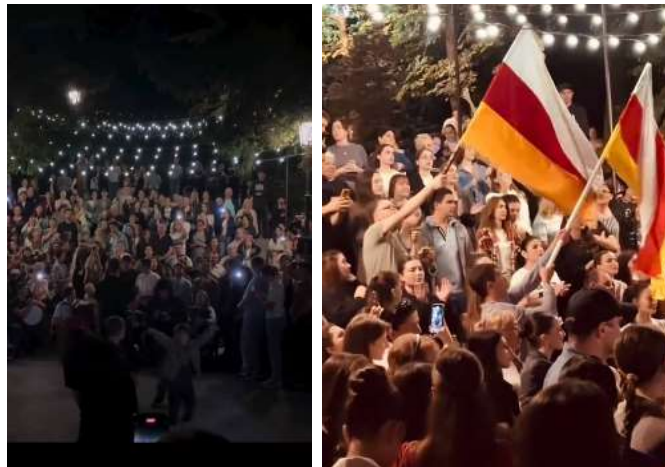
Вечер в Осетии

Я родилась в Осетии и не разделяю её на Северную и Южную, как и все остальные жители моего родного края. Для всех это один общий дом, который хочется защищать и оберегать. Гуляя по улочкам Владикавказа, то и дело сталкиваешься с историей предков: оформление кофейни, рисунки на стенах или отреставрированные, но сохранившие историю, здания в центре города. Везде всё напоминает о твоих корнях. В Цхинвале ты буквально дышишь горным воздухом. Если Владикавказ - это город, находящийся в постоянном движении, то Цхинвал - это полное спокойствие, умиротворение и вид на горы, разбивающий сердце от неимоверной красоты, но в тоже время являющийся успокоением души.